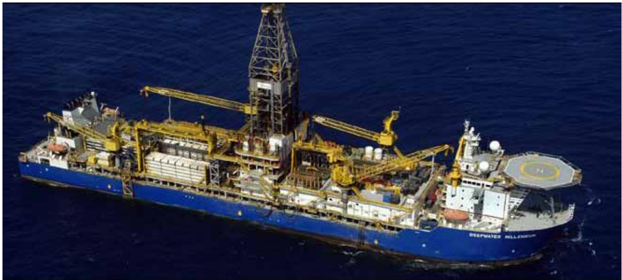
Foto: Pormenor de uma plataforma da Anadarko, pesquisando em águas profundas (www.anadarko.com)