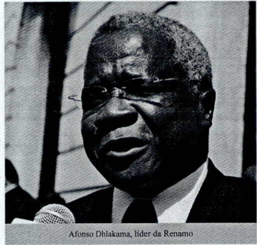
Afonso Dhlakama, líder da Renamo

que eu estava à procura do lugar de Dhlakama, tinha que matar a ele para eu ficar como presidente da Renamo. Essa mentira começou a circular. Eu cesso da CNE, volto ao partido e não sou afecto. Fico um ano inteiro à espera da colocação ou do que ia fazer dentro do partido. Nessa ocasião, as mentiras se multiplicavam. Eu escapei a um atentado no distrito de Morrumbala, porque a informação já tinha se espalhado e chegado aos desmobilizados da Renamo. Mas um deles acabou me dizendo: "olha, acabamos de receber uma mensagem essa noite que diz quem encontrar o Samuge tem que disparar porque ele anda a procurar formas para eliminar o presidente, para ele ser presidente da Renamo", algo que nunca passou pela minha cabeça.